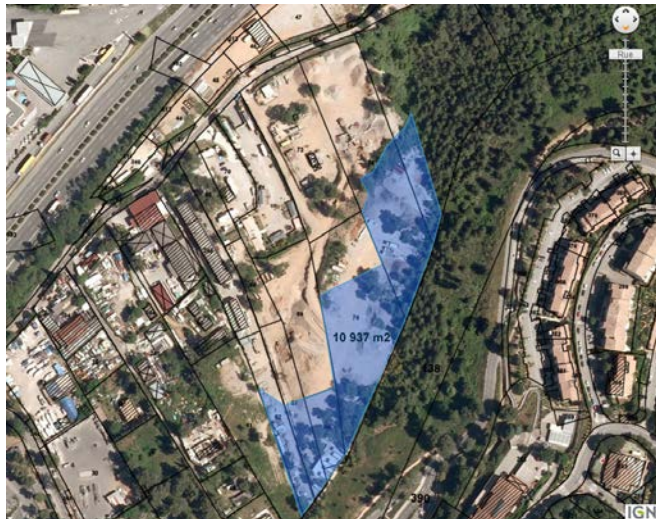
Zone bleue : 11 000m 2 d'espaces boisés classés détruits.

Nous espérons que la raison reviendra, mais soyons sûrs que l'opinion des habitants de Mougins devra peser encore plus lourd.